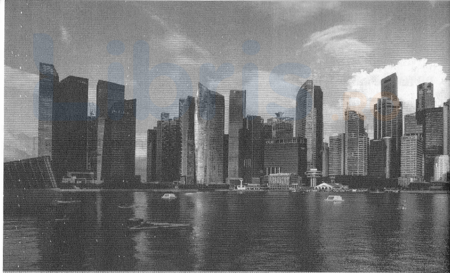
Marina Bay, Singapore într-o dimineață devreme de iulie

care încă de la început a ținut să menționeze că aparține Cataloniei și nu Spaniei. O atitudine pe care o respect fără rezerve, dar cu care nu pot fi deloc de acord – este o chestiune de identitate pentru el și una politică pentru mine. Nu am o părere bună despre separatiști, în general, dar pentru moment, acest lucru este irelevant. Fiecare dintre noi încearcă să se bucure cât mai mult de oferta celor de la Singapore Airlines : el bea Baileys 1 , eu, vin... și, uite așa, orele de zbor, poate, trec mai repede!